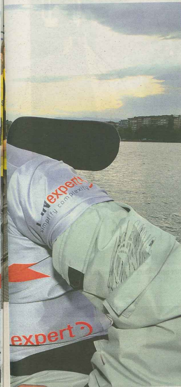
sence de polyhandicap.

colté ira directement à la fondation afin de permettre aux personnes en présence de polyhandicap de poursuivre leurs activités sportives.