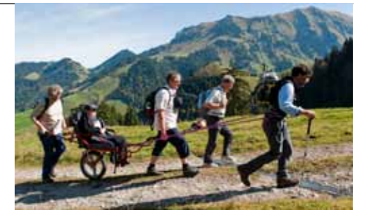
Randonnée en joëlette dans la nature.

différente. Certaines, d'habitude habituées au sport, n'ont pas peur. D'autres doivent être progressivement familiarisées avec le tandemski. Pour moi, ces personnes sont des skieurs comme les autres. Je ne suis que leur paire de skis. Mon plaisir est de lire le leur sur leur visage.»