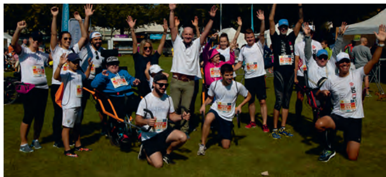
Une joëlette de Just for Smiles prête au départ