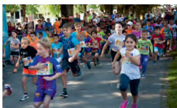
Départ de la catégorie des moins de 10 ans