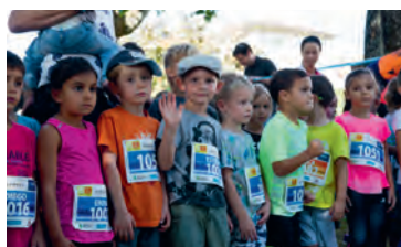
Futurs champions sur la ligne de départ