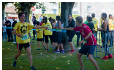
Passage de témoin de l'équipe gagnante du Défi 1020Run