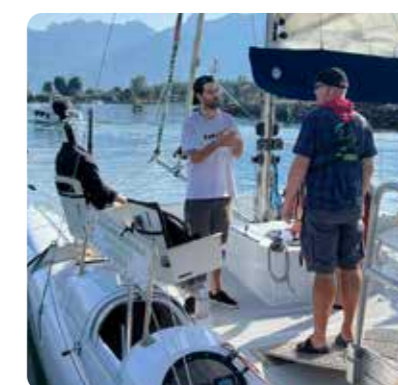
SÉANCE DE CAPTATION VR* Pour des sensations bien réelles

Nous sommes impatients de continuer à élargir l'impact de la réalité virtuelle chez Just for Smiles, contribuant ainsi à créer un monde où le sport et le bien-être sont accessibles à tous, indépendamment des défis physiques.