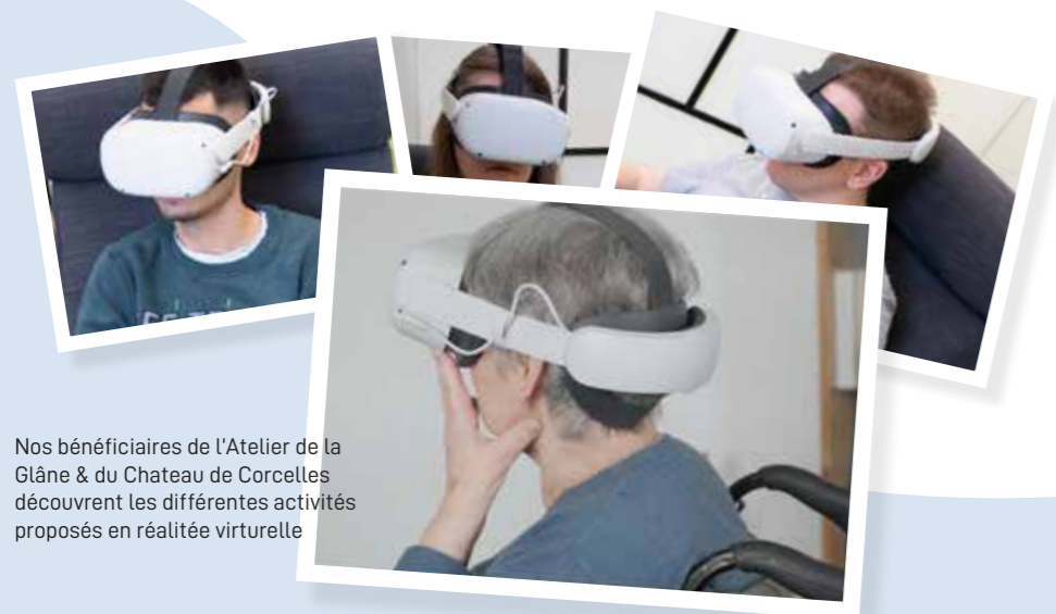
Nos bénéficiaires de l'Atelier de la Glâne & du Château de Corcelles découvrent les différentes activités proposés en réalité virtuelle

Notre nouveau projet de réalité virtuelle a pour objectif de démontrer le potentiel de la technologie, et en particulier de la réalité virtuelle, en matière d'accroissement de l'accessibilité des activités extrascolaires et de loisirs pour tous les enfants et les jeunes en suisse, quelles que soient leurs capacités motrices, psychiques et sensorielles. prévu pour premier déploiement en suisse romande, il vise à offrir à toutes nos institutions partenaires une technologie ayant fait ses preuves à l'étranger, notamment en france: des capsules d'expériences immersives adaptée aux troubles moteurs, psychiques et sensoriels, permettant de faire ressentir aux bénéficiaires des sensations intenses, souvent oubliées ou jamais vécues, au travers du simple port d'un casque de réalité virtuelle. le projet permettra à la fois de faire participer les enfants et les jeunes en situation de handicap dans un monde virtuel qui ne présente pas de barrière pour elles et eux, mais également d'augmenter leur participation aux activités sportives et de loisirs dans la vie réelle, car la réalité virtuelle agit comme une préparation désensibilisante.